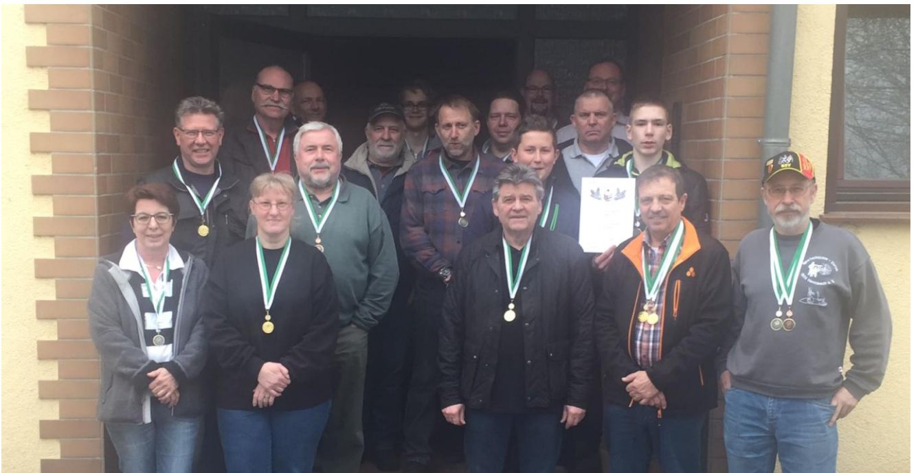
OSP und VL 50m