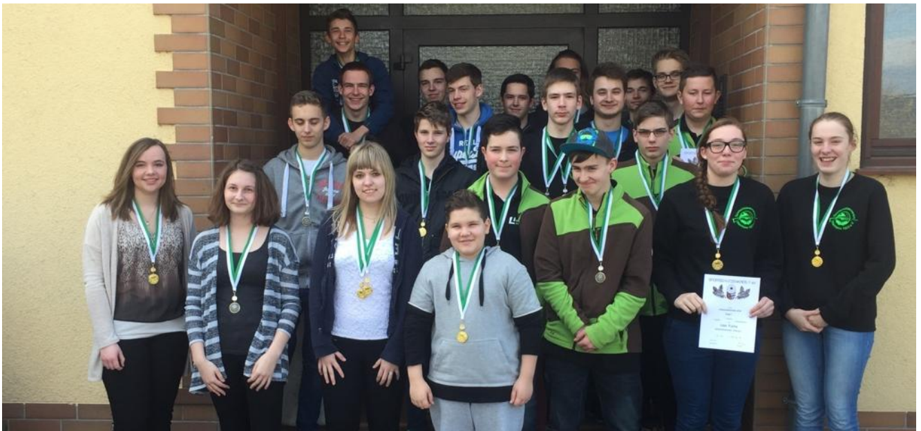
LP + LG Jugend