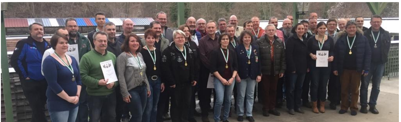
LG + LP