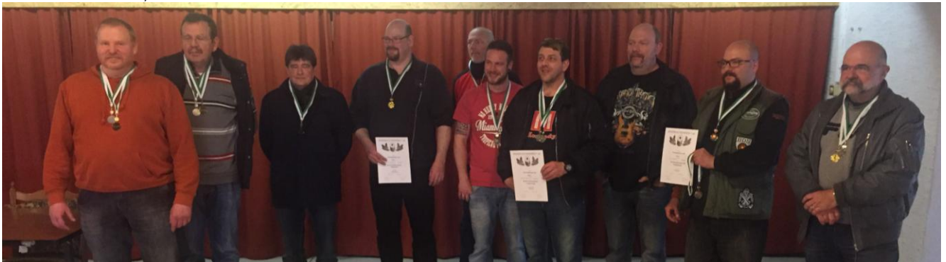
Pistole 9mm und 357.mag